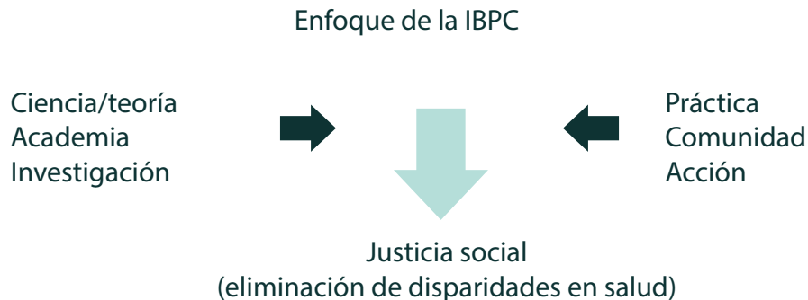
Figura 1: Marco teórico y enfoque del modelo de la IBPC.

Los principios base de la IBPC tienen origen en las décadas de los 50 y 60, surgiendo como resultado de la fusión de dos formas tradicionales de hacer participativa la investigación [6]. El enfoque tradicional del “hemisferio sur” reconoce la necesidad de trabajar conjuntamente contra las fuerzas del estancamiento social, estipulando que cuando las personas son conscientes de su situación y de las condiciones o fuerzas opresoras que no los dejan progresar, estas (las personas) necesitan trabajar colectivamente para construir un mejor futuro. Sumado a este principio se integra el enfoque del “hemisferio norte”, el cual enfatiza el cambio social a través de ciclos sucesivos de acción reflexiva. Este enfoque también enfatiza en la necesidad de que los procesos y resultados de una investigación sean útiles para los miembros de una comunidad a fin de lograr un cambio social positivo y promover la equidad social [5, 6].